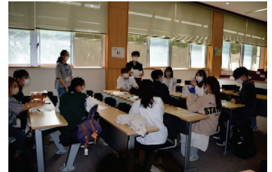
図4 ゲスト留学生との交流会

グループ別にローテーションでゲスト留学生の皆さんとフリートークを行った(図4)。各グループにファシリテーターが置かれ、ゲスト留学生の皆さんと英語で楽しく会話することができた。GFL生からの質問が絶えず、とても賑やかな交流となった。