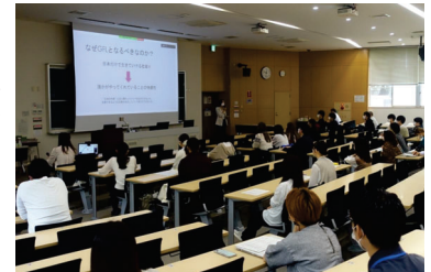
図3 GFL上級生の留学体験発表

留学経験のあるGFLの先輩方や修士に自身が体験した留学準備や現地での生活について発表していただいた(図3)。オンラインで留学した先輩だけでなく、中国、オーストラリアなど現地に留学した先輩の話をも直接聞くことができた。