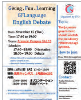
図3 デイバートポスター