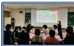
図5 第1回 [Meet & Mingle!]

ウクライナの留学生をゲストに招き、自国紹介を交えた国際交流を行った。zoomを使用し、オンラインで開催(図7)。