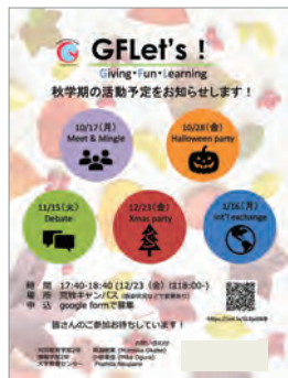
図2 後期活動ポスター