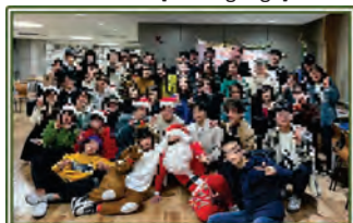
図11 第7回 [Christmas Party]