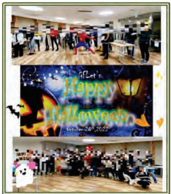
図9 第5回 [Halloween Party]