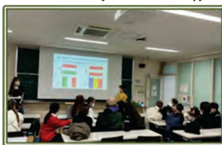
図12 第8回 [Quiz Competition]