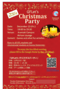
図4 クリスマスパーティポスター