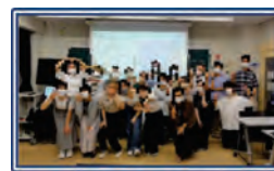
図6 第2回 [GFLanguage]