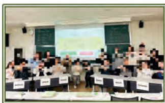
図10 第6回 [GFLanguage]